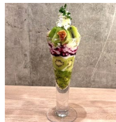
キウイフルーツパフェ 1,342円 (みのりカフェ博多)