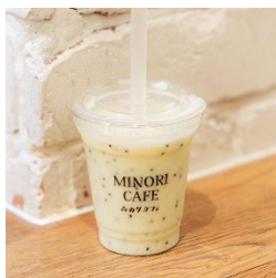
国産キウイフルーツの スムージー759円 (みのりカフェ仙台)