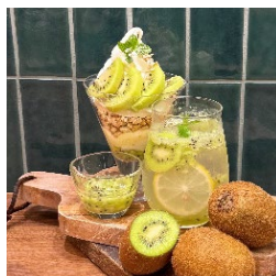
国産キウイフルーツの ミニパフェ759円 自家製国産キウイフルーツシ ロップのスカッシュ715円 (みのるダイニング名古屋)