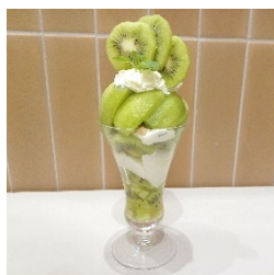
国産キウイフルーツの DXパフェ1,690円 (みのる食堂銀座)