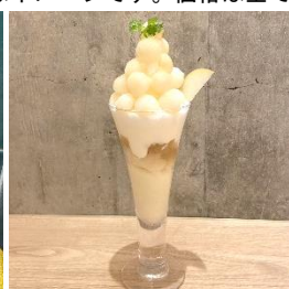
国産梨の白いパフェ 1,408円 (みのりカフェ博多)