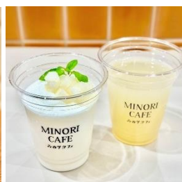
梨ヨーグルトスムージー750円 生絞り梨ジュース720円 (みのりカフェ銀座)