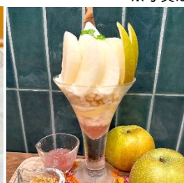
国産梨のパフェ 1,969円 (みのるダイニング名古屋)