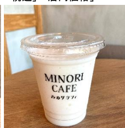
梨スムージー 649円 (みのりカフェ季楽)